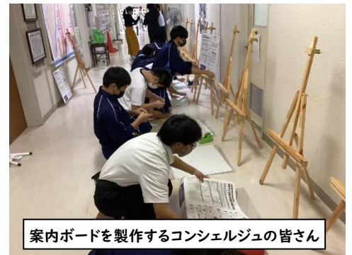
案内ボードを製作するコンシェルジュの皆さん

市内教員の恩師である参観者からは『丁寧に案内してくれる成長ぶりに、感動して涙が出そうだった』『先生たちだけがやっている研究会じゃない、僕たちの姿を見てもらうんだという気持ちを感じた』という感想をいただきました。