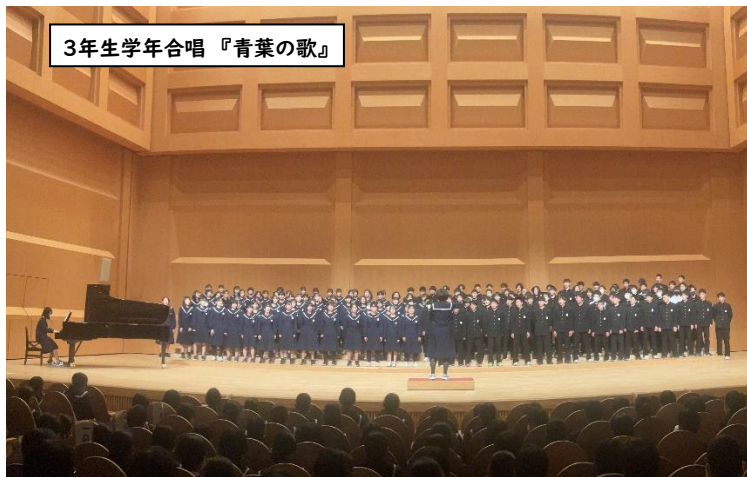
3年生学年合唱 『青葉の歌』

『合唱』は『学習』『掃除』とともに竹鼻中学校を支える3本柱の一つです。感染症予防のための合唱自粛が長く続き、ようやく声を出し、仲間と声をそろえて一つの曲を作り上げる活動が再開しました。