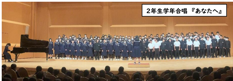
2年生学年合唱 『あなたへ』