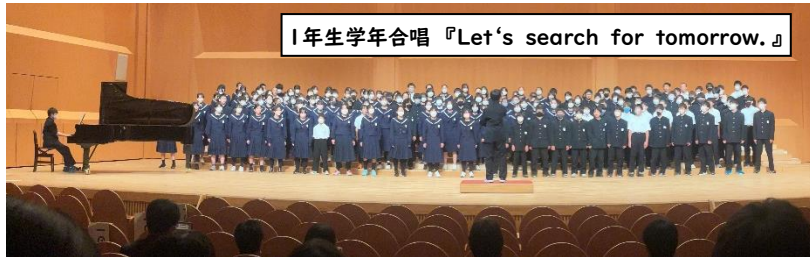
1年生学年合唱 『Let's search for tomorrow.』

うまくいなくて仲間とぶつかったり、取組の時間が短くて焦ったりと、いろいろなものを乗り越えて創り上げた『合唱』。この合唱を創り上げた思いが私たちの学級の財産になりました。この財産をこれからの学校生活に生かしていきたいと思いました。