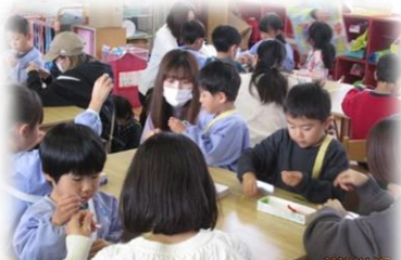
保育参観で・・・