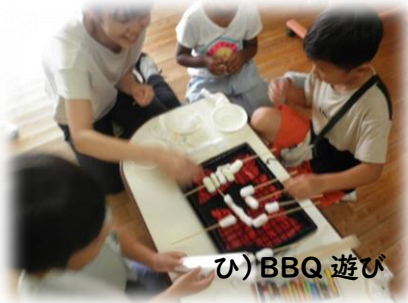
ひ) BBQ 遊び