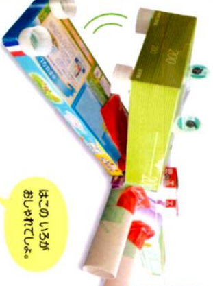
↑おおきな <50 のこ [40x30cm, 40x70, 40x70]