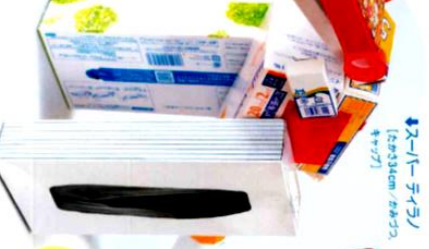
↑スーパー ティーブル [20x30cm, 40x70]