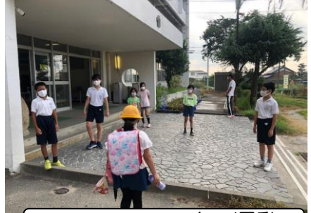
生活委員会のあいさつ運動

まだまだ、気を緩めることができない状況です。もしもの時を考えて対応をしてまいりたいと思っていますので、引き続きご理解とご協力をお願いいたします。