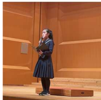
(合唱委員長の語り)

1年生は、初の大舞台での合唱。交流会では、先輩から姿勢のアドバイスを受け、仲間と意見を出し合い日々成長していく姿がありました。