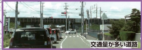
交通量が多い道路