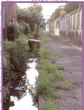
雨が多く降ると水量が増す