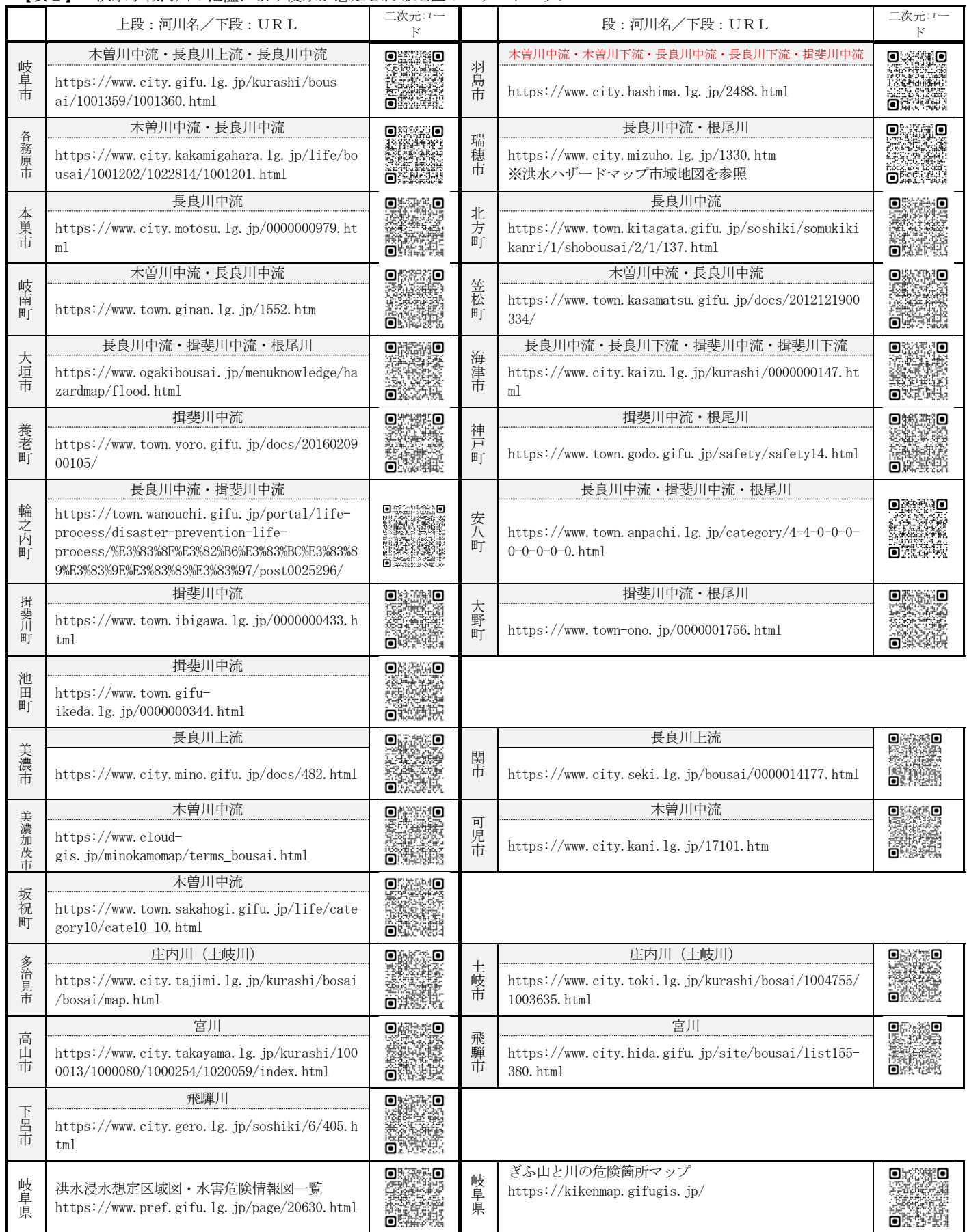
【表2】 洪水予報河川の氾濫により浸水が想定される地区のハザードマップ

※その他の河川及び上記に記載のない市町村の洪水浸水想定区域については、各市町村のHP等を参照のこと。